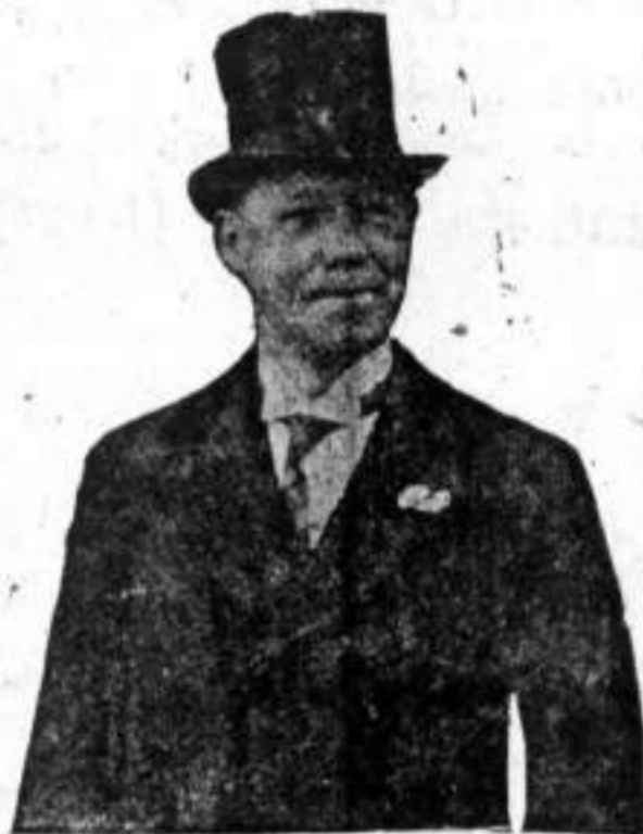
DR. ENRIQUE OLAYA HERRERA

Bogotá 27.- El Presidente de la República Dr. Olaya Herrera acaba de emitir un maravilloso Decreto por medio del cual se suprimen desde el 19 de Diciembre los juzgados de Prensa y Orden Público, inútiles rodajes administrativos que venían costando un dineral a la Nación y