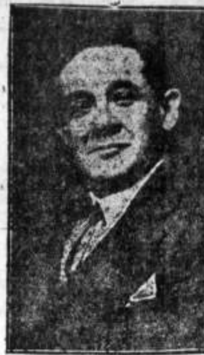
GRAL. MORALES OLAYA