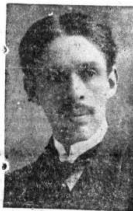
DR. EDUARDO SANTOS