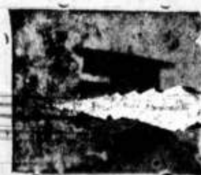
PRIMO DE RIVERA

Un éxito sin precedentes deseamos a la compañía por esta noche.