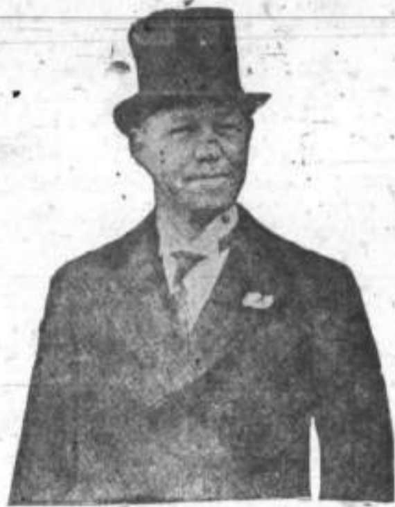
EXCELENTISIMO SEÑOR DR. OLAYA HERRERA

ANO III | REPUBLICA DE COLOMBIA | DEPARTAMENTO DE CALDAS - PEREIRA, MARTES 15 DE SEPTIEMBRE DE 1931 - N° 787