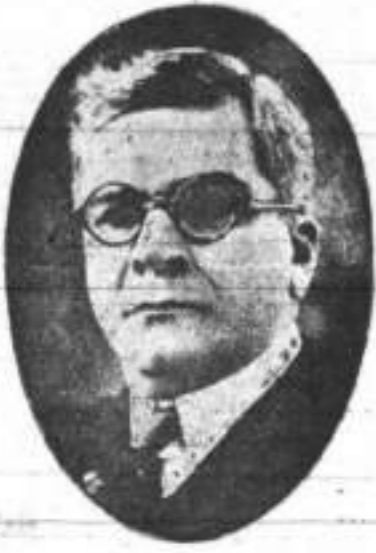
GRAL. MACHADO Presidente de Cuba.

Los cuarteles generales del gobierno en esta ciudad se observan grande agitación desde ayer, a pesar de las afirmaciones que se hacen en la presidencia de que la marcha bien. Se afirma, como cosa efectiva, que dos goletas, una alemana y otra noruega, desembarcaron anoche un refuerzo de hombres rebeldes, en su mayoría negros, así como numerosas ametralladoras y un cargamento de cartuchos, en las costas de Gibara.