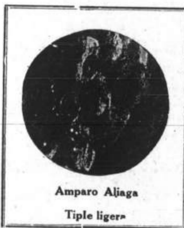
Amparo Aliaga Tiple ligera