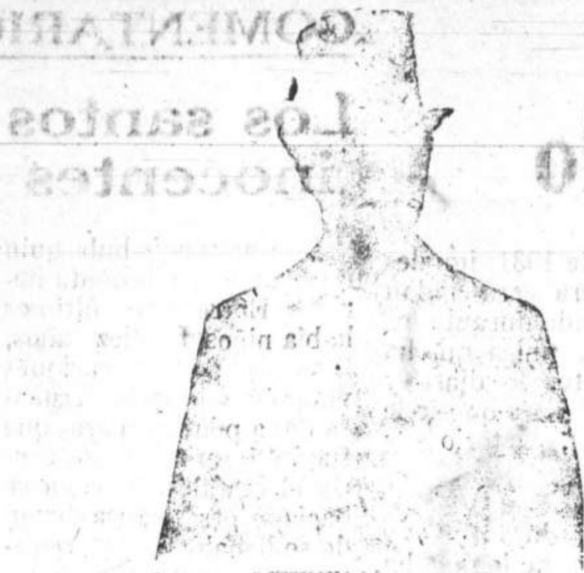
Dr. Enrique Olaya Herrera