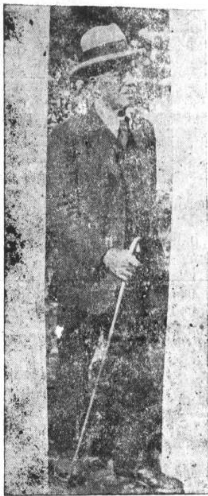
DON CARLOS ECHEVERRI URIBE

quí el día clásico de "La Mazorca". Día de fiesta; placentera y espontánea adición de dulcísimos recuerdos a la mesa que suena con melancólicas acordes el toque de la guitarra en los hogares antioqueños. Día feliz para el anciano que contempla al reflejo de su mesa la docena de renuevos que durante el año estuvieron diseminados en las regiones haciendo fortuna a la fortuna. Hoy visiblemente amarillo los rastros de las cabañas; la lluvia anuncia con sus flores que se acerca la fiesta de los pobres; de los que vieles por vez primera en las cabañas. Hoy es el día de la buena leña, del mechero nuevo y las pailas limpias descendiendo de las vistas secas turegas de maíz para convertirse en harina después de danzar en el horno nuevo, blanca y ceñida a unirse a la temblorosa masa para formar los buñuelos.