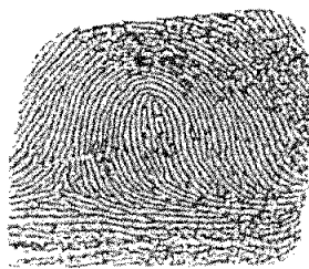
INDICE DE REGISTRO