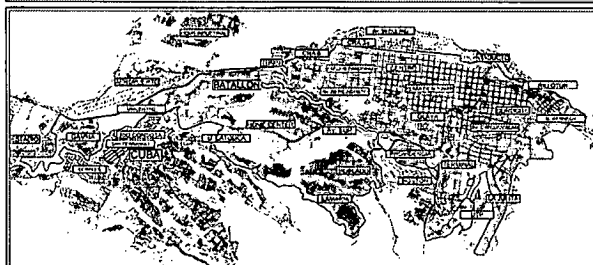
ZONA DE INFLUENCIA PLAN DE OBRAS 2013-2015