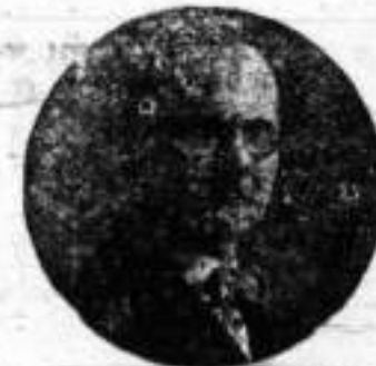
DR. MIGUEL ABADIA MENDEZ

Presidente de la República, cuyo retiro en estos momentos podía ser el remedio para solucionar la grave situación que el país atraviesa, siempre que se procediera a nombrar nuevos Designados.