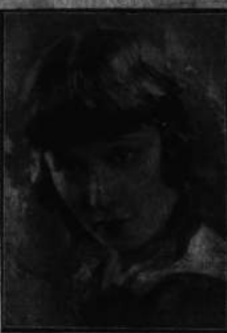
LILA KIWA ESTA NOCHE EN EL TEATRO CALDAS

Tenemos noticias de que hoy será inaugurado en forma oficial y de manera muy elegante, el campo de aterrizaje que ha construido el vecino municipio de Cartago, sobre terrenos de su exclusiva propiedad. Dado el enorme beneficio que trae para los pueblos de occidente este campo, del cual hará uso la Seadta y también en casos de emergencia la aviación militar, tenemos que registrar complacidos su inauguración, a la vez que enviamos nuestros parabienes al municipio y a la ciudadanía cartagüena.